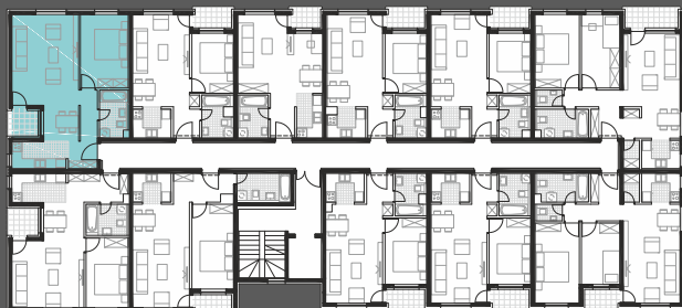
STAN T-01/1.01; 2.12 ----- Avenija Dubrava -----